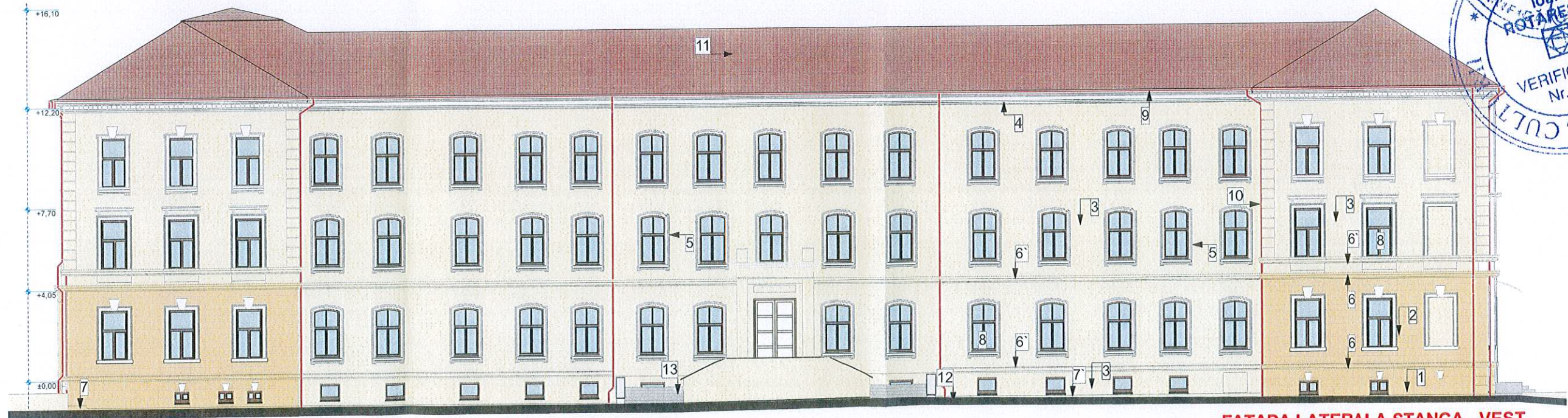
FATADA LATERALA STANGA - VEST