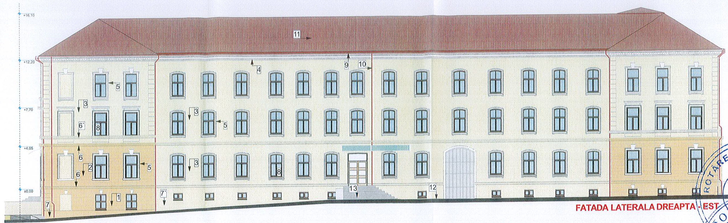
FATADA LATERALA DREAPTA - EST