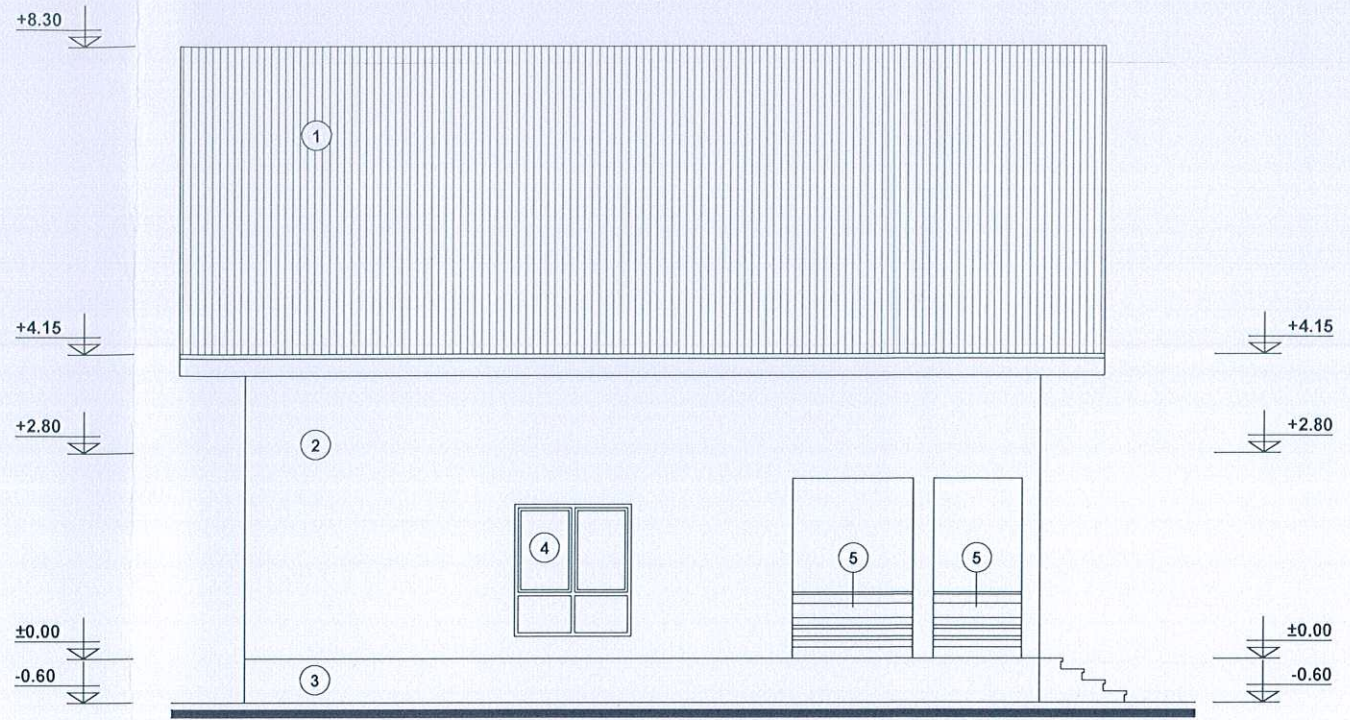
FATADA LATERALA STANGA Scara 1:100